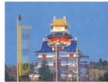
伊勢安土桃山文化村